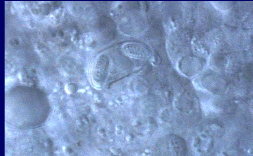
Enteromyxum leei en orada