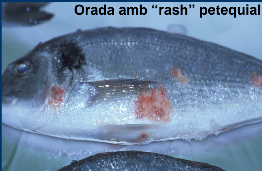
Orada amb "rash" petequial